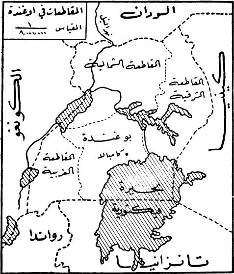
شكل رقم (٢)