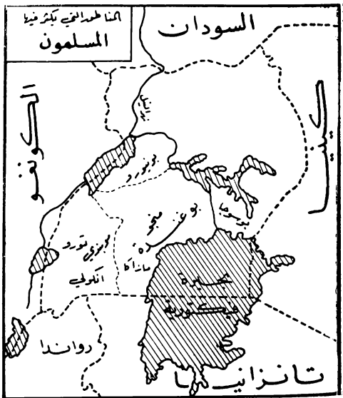
( شكل رقم ٥ )